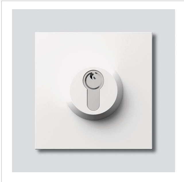
Schloss-Modul SM 611-01 W 200019404-01