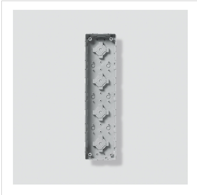
Unterputzgehäuse GU 611-4/1-0