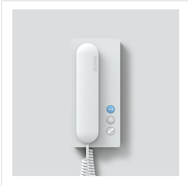
Haustelefon Analog HTA 811-0 W