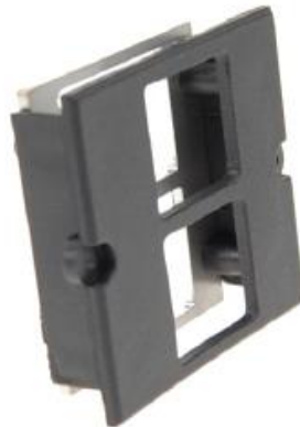
Profil / Profile