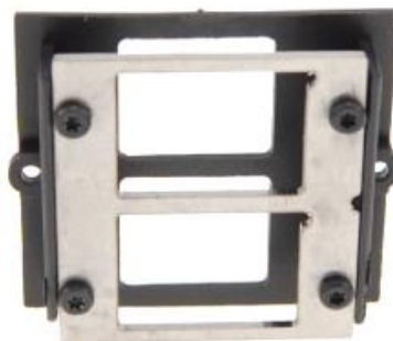
Rückseite / Back side view