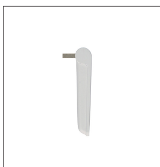
Abb.2: Art. 137550 (Seitenansicht)