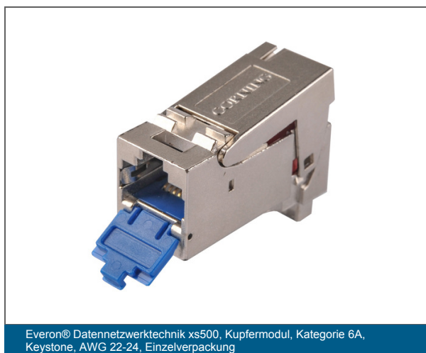
Everon® Datennetzwerktechnik xs500, Kupfermodul, Kategorie 6A, Keystone, AWG 22-24, Einzelpackung

Getestet und zugelassen für Power-over-Ethernet-Anwendungen (PoE/PoE+/4PPoE) nach IEEE 802.3af, IEEE 802.3at und IEEE 802.3bt bis zu 90W