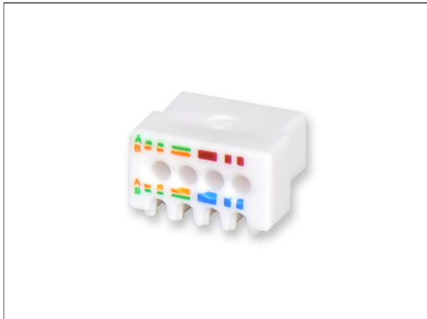
Everon® Datennetzwerktechnik xs500 Kupfermodul, Kategorie 6A, Keystone, AWG 22-24, Großpackung (24 Stk.)