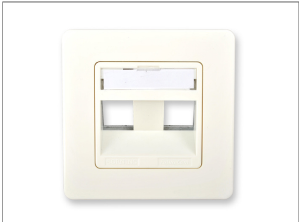
Everon® Datennetzwerktechnik Zentralplatte mit Tragrahmen, 3 Ports, schräg, für bis zu 3 x Everon® Datennetzwerktechnik xs500 Keystone Kupfermodule, 50x50 mm, weiß