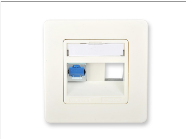
Everon® Datennetzwerktechnik Zentralplatte mit Tragrahmen, 3 Ports, schräg, für bis zu 3 x Everon® Datennetzwerktechnik xs500 Keystone Kupfermodule, 50x50 mm, weiß