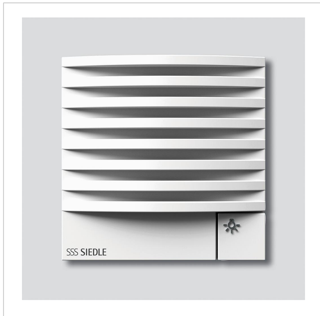
Türlautsprecher-Modul 6+n TLM 611-02 W 200036931-00