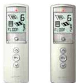
Telis 16 RTS Pure