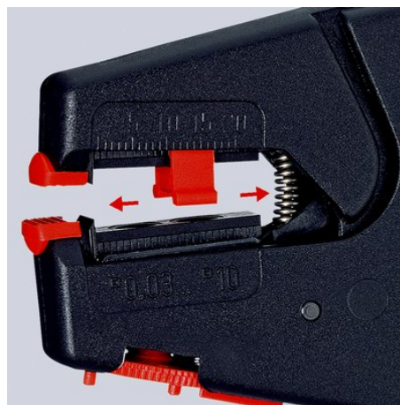
12 40 200: Einstellbarer Längenanschlag