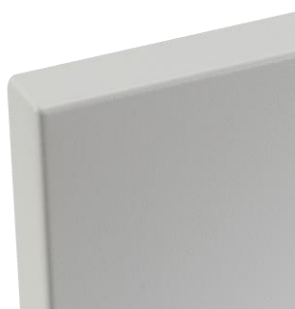
Detail der Ecke