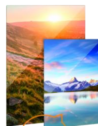
Bedruckt als VL-AxxxxxB