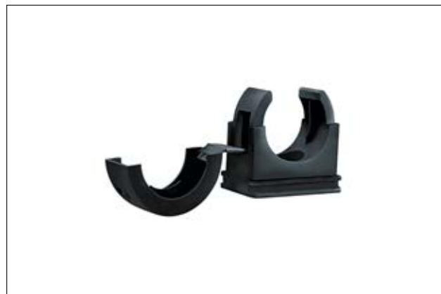
HelaGuard PACC Befestigungsschelle.