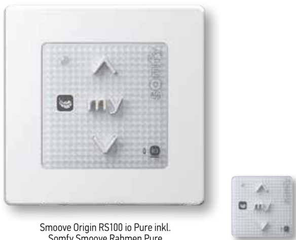
Smooove Origin RS100 io Pure inkl. Somfy Smooove Rahmen Pure

1-Kanal-Funkwandsender zur manuellen Steuerung eines io-Funkantriebs/io-Funkempfängers oder mehrerer io-Funkantriebe/io-Funkempfänger gleichzeitig per Funk.