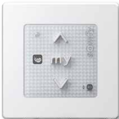
Smoove Origin RS100 io Pure inkl. Somfy Smoove Rahmen Pure