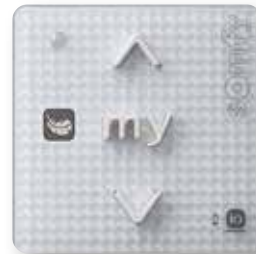
Smoove Origin RS100 io Pure