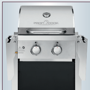
Klappbare, platzsparende Seitentische – auch ideal für den Balkon geeignet (ca. 61 cm breit)