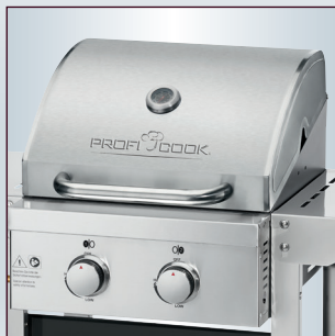
Hochwertige Edelstahlfront und -haube