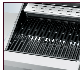
Geteilte Grillfläche: 2 emaillierte Grillroste