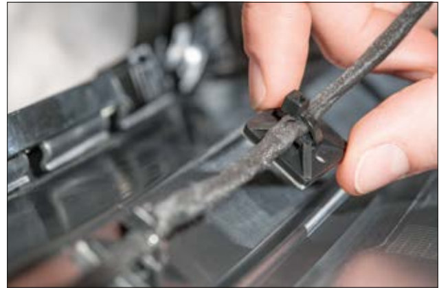
Quadratische SolidTack MB Sockel - schraubbar, selbstklebend - geeignet für eine Vielzahl von Anwendungen wie die Befestigung von Kabeln in der Automobiltechnik.