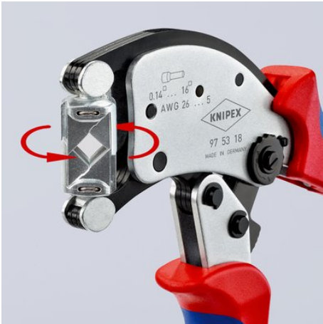
360° drehbarer Crimpkopf für beste Zugänglichkeit auch unter beengten Verhältnissen