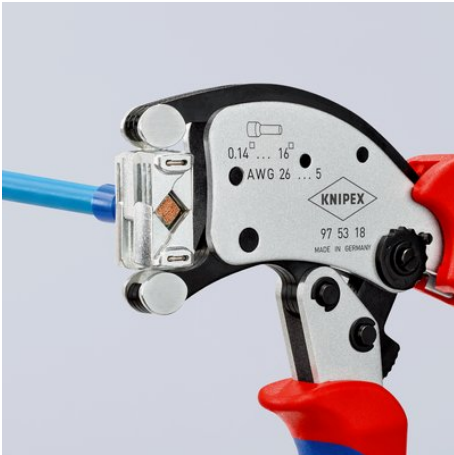
Einmalig flexibel: Verbinder können aus nahezu jeder Position in den drehbaren Crimpkopf eingeführt werden