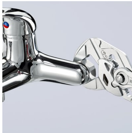
Arbeiten auf verchromter Armatur, ohne Beschädigung der Oberfläche