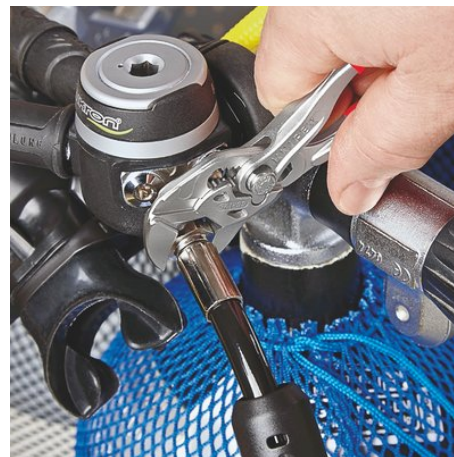
der Mini-Zangenschlüssel für feinmechanische Arbeiten