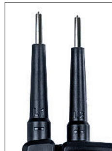
Mit aufgeschraubten Metallhülsen 4 mm