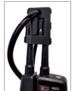
Schutzkappe mit Aufnahmefach für Metallhülsen